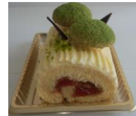
パステリーフーズ 「ブッシュドミニノエル」